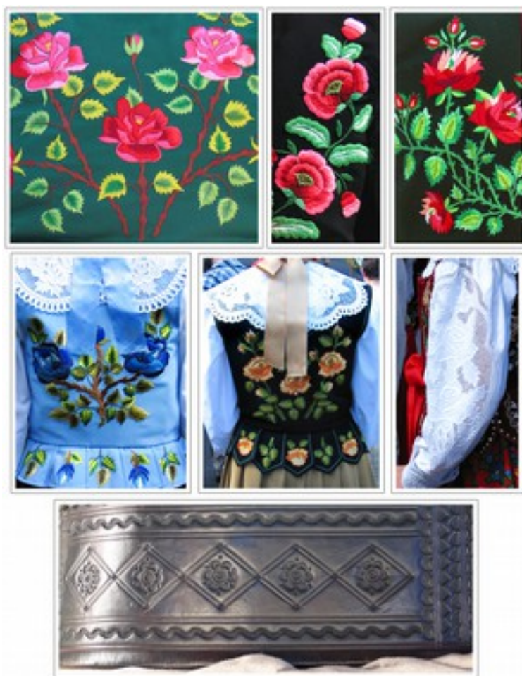
Fig. 3. Motyw róży wykorzystywany w zdobnictwie podhalańskim