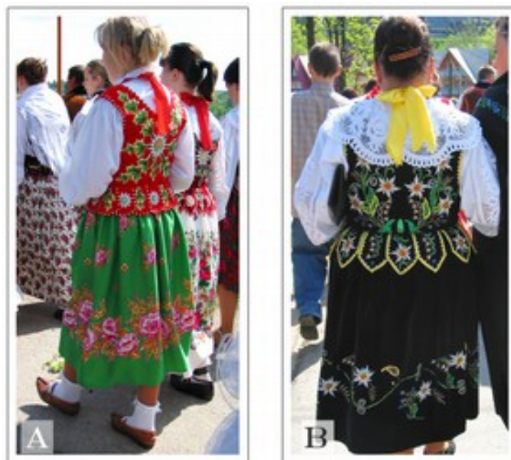
Fig. 7. Strój kobiety zwany „Ubraniem”, A- haftowany gorset i kwiecista spódnica tybetowa, B- gorset i spódnica są uszyte z takiego samego materiału