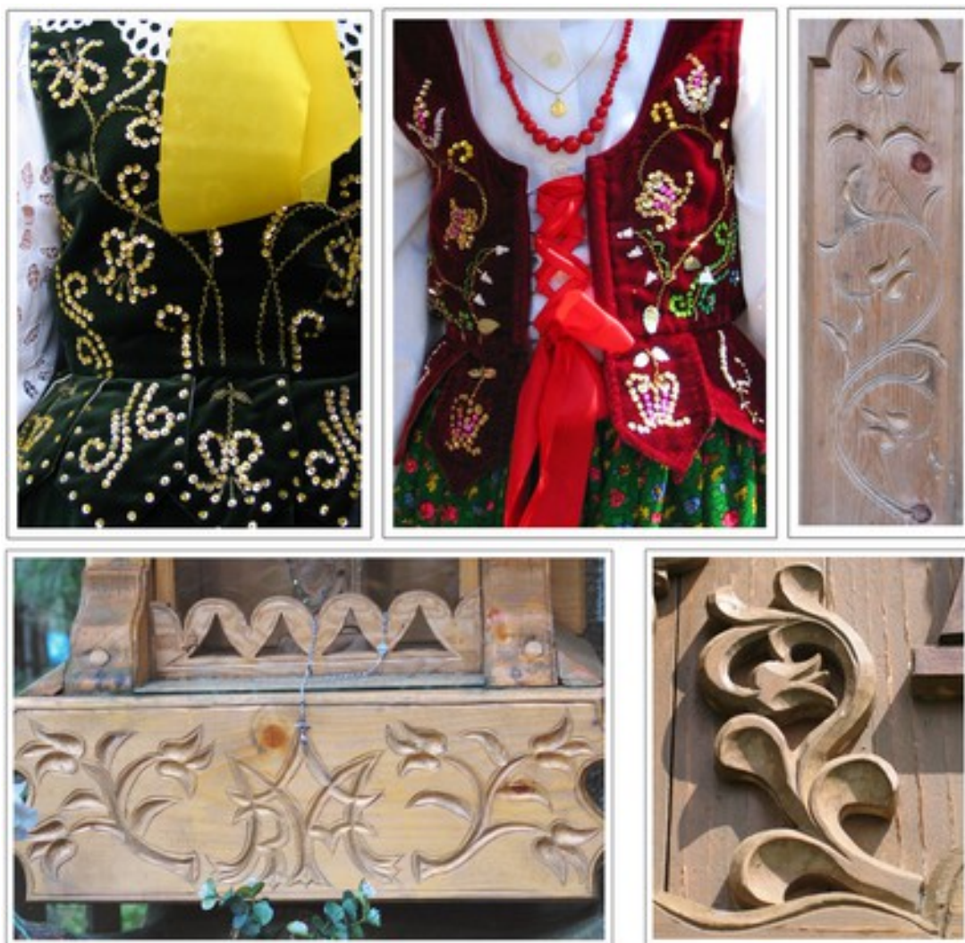
Fig.2. Motyw lelui