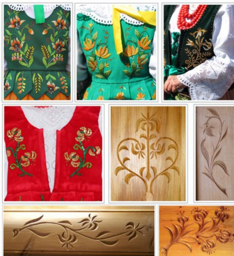
Fig.1. Motywy lilii wykonane na różnych materiałach