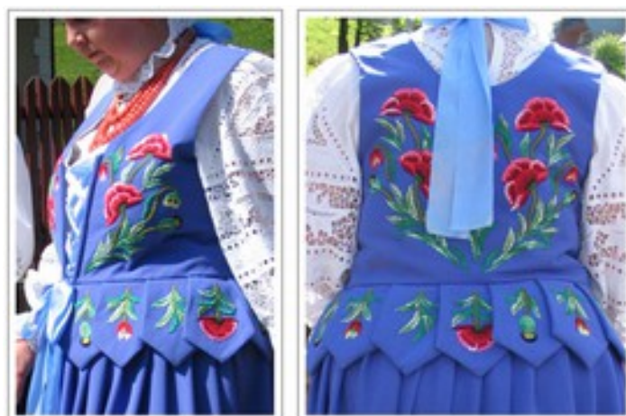
Fig. 8. Zdobienie kobiecego gorsetu