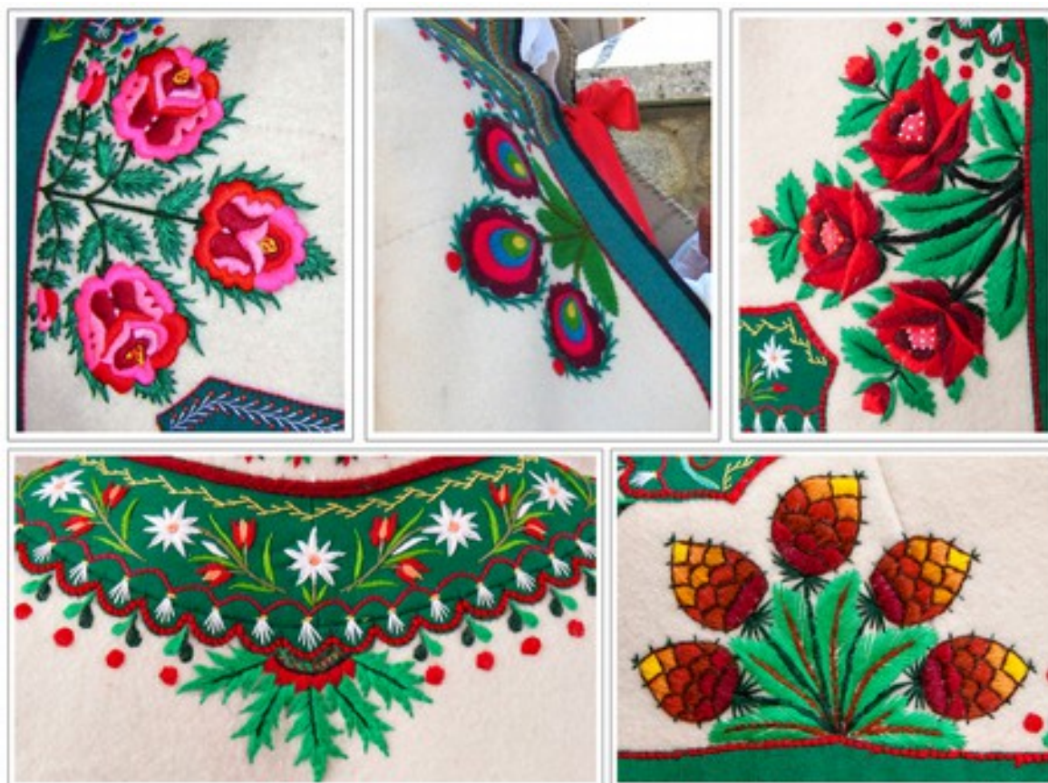
Fig. 10. Zdobienie stroju męskiego