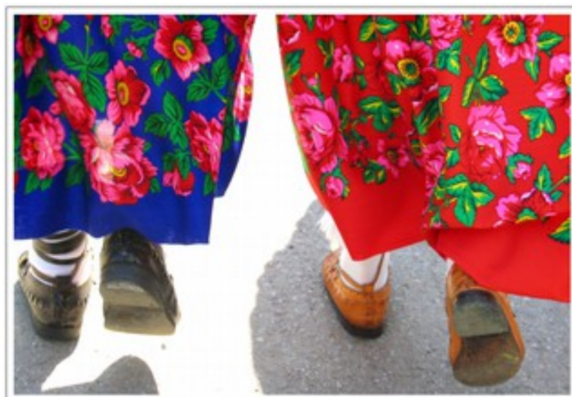
Fig. 9. Tybetowe kwieciste, różane spódnice