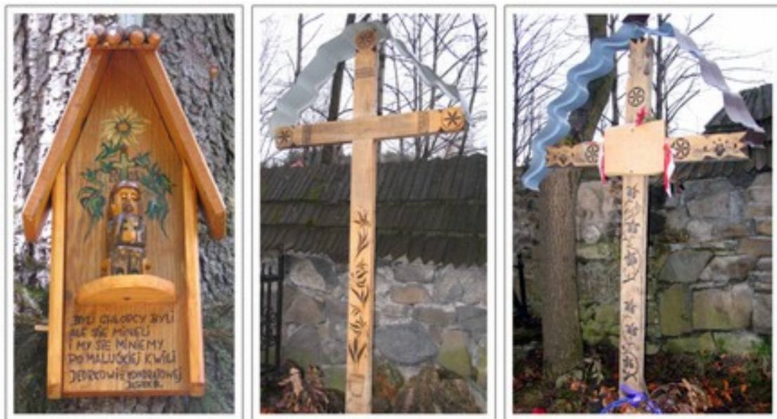
Fig. 12. Zdobione krzyże i kapliczka