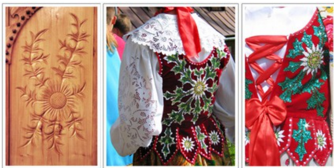
Fig.4. Motyw dziesięciu