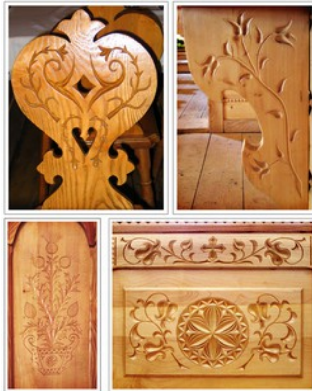
Fig. 11. Elementy zdobnicze wykonane w drewnie