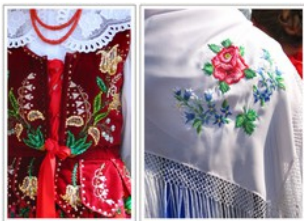
Fig.6. Mniejsze elementy roślinne uzupełniające główne motywy zdobnicze