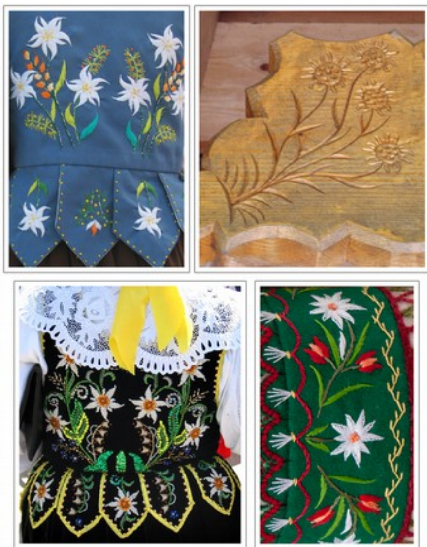
Fig.5. Motyw szarotki