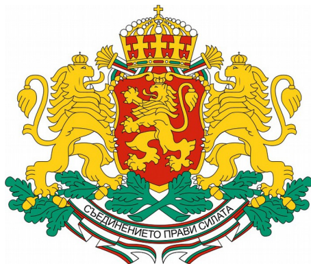
Fig. 1. Herb wielki Bułgarii.

przeszłości. Symbole narodowe (i występujące w nich motywy botaniczne) pomagają budować tożsamość narodów oraz utrzymywać więź z naturą ale również historią.