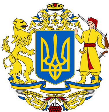
Fig. 7. Nieoficjalny herb wielki Ukrainy.