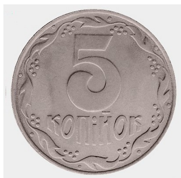
Fig. 8. Rewers ukraińskiej monety o nominale 5 kopiejek.