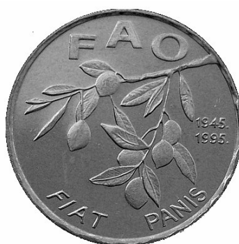
Fig. 6. Rewers chorwackiej monety 20-lipowej.