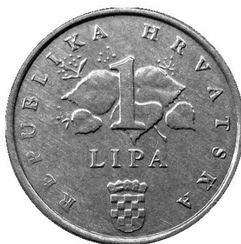
Fig. 5. Awers chorwackiej monety 1-lipowej.