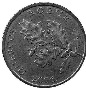
Fig. 2. Chorwacka moneta o nominale 5 lip